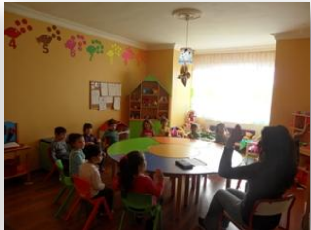
2007 Büyükler Almanca