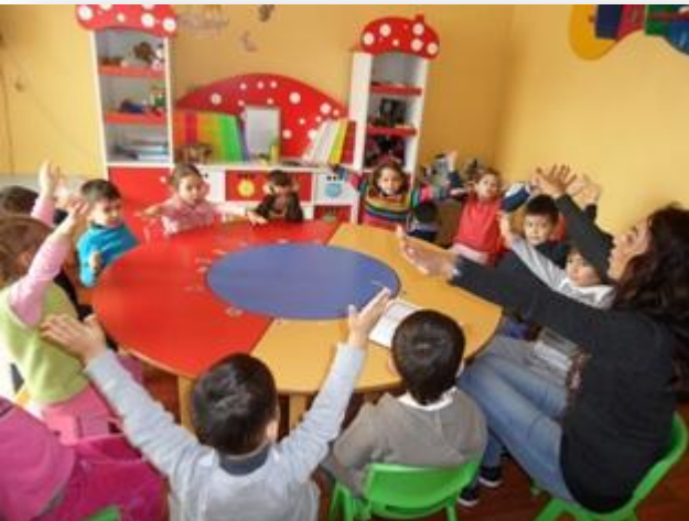
2007 Küçükler Almanca