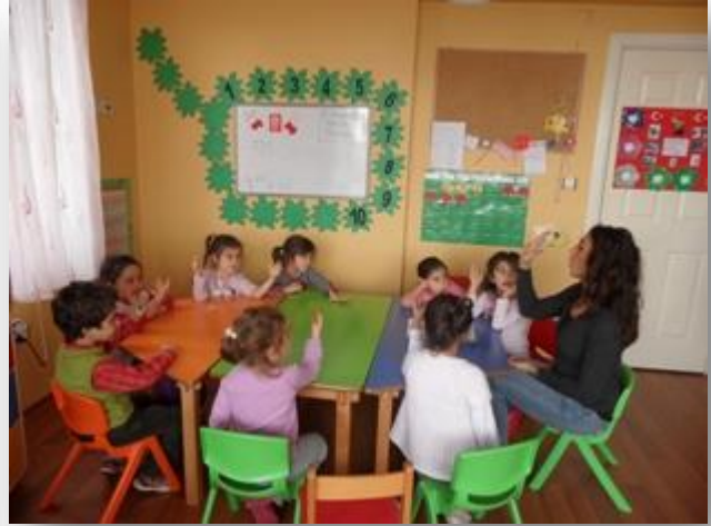
2006 Doğumlular Almanca