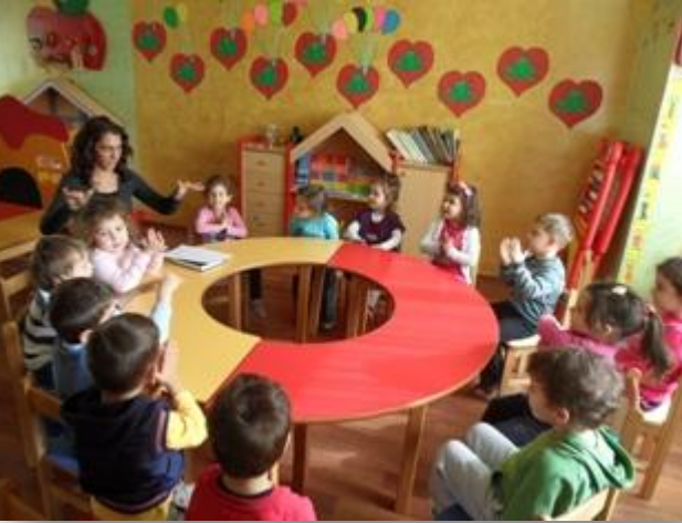
2008 Doğumlular Almanca